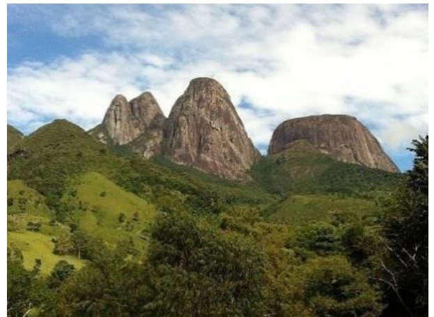
Figura 03 - Serras

Serras: As serras constituem relevos irregulares, geralmente seguida de partes altas e partes baixas, formando uma crista.