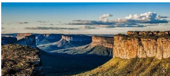
Figura 02 - Planaltos

Planaltos: Os planaltos são terrenos relativamente planos e situados em áreas de altitude mais elevada. São limitados, pelo menos de um lado, por superfícies mais baixas.