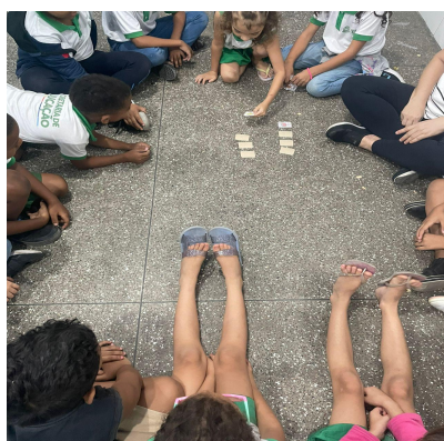
Fotografia 1, 2, 3, 4, 5 e 6 - Jogos, Atividade, Leitura e Acolhida

Assim, observamos que alfabetizar não é apenas ensinar a ler e escrever, mas formar sujeitos leitores e produtores de textos, capazes de compreender e participar ativamente das práticas sociais.