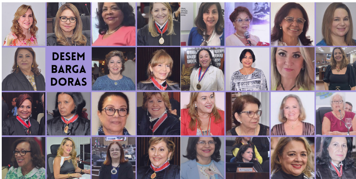
Figura 2 - Mosaico de Desembargadoras do TJ-BA.